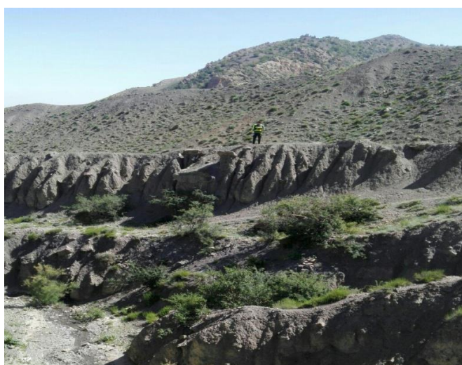
شکل ۴- گسترش فرسایش خندقی در زمین های شیب دار مرتعی.

به منظور بررسی دقت و اعتبار نقشه های خطر تولیدی، از منحنی ROC و آماره ی AUC استفاده شد و در نرم افزار R رسم گردید. شکل ۲، منحنی ROC برای تعیین دقت نقشه ی فرسایش خندقی را