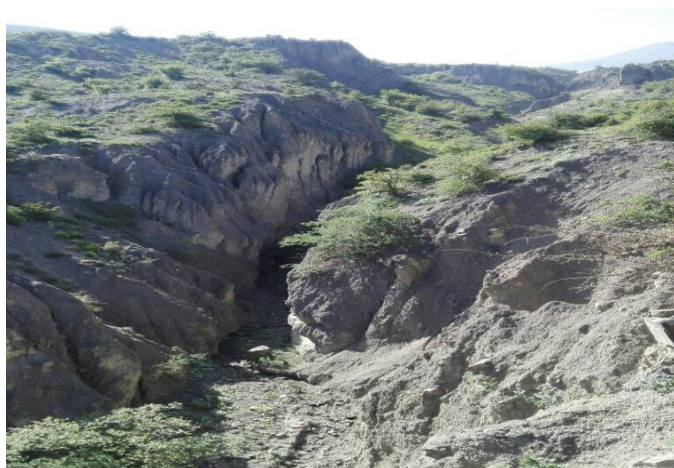
شکل ۵- گسترش فرسایش خندقی در زمین های جنگلی تخریب شده.