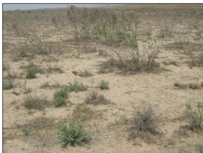
شکل ۲- وضعیت پوشش گیاهی در عرصه‌ی بخش پس از اجرای طرح پخش سیلاب.