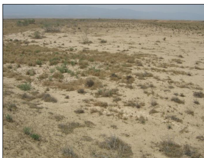
شکل ۳- وضعیت رسوب‌گذاری در پشته‌های آب‌گیر پخش سیلاب.