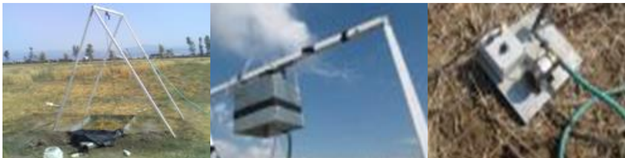
شکل ۱- شبیه‌ساز باران قابل حمل مدل \Delta 330 ساخت Delta lab Eid

بهره‌گیری در همانندسازی باران، از داده‌های مربوط به ایستگاه سینوپتیک گنبد در فاصله ۵۰۰ متری سایت مورد مطالعه استفاده شد. با توجه به این که در عملیات اصلاحی آبخیزداری به منظور اقدامات کنترلی فرسایش و رسوب، بارندگی‌هایی با دوره بازگشت ۱۰ تا ۲۰ ساله مورد نظر است (Esmali و همکاران، ۱۳۸۹)؛ مطابق این داده‌ها، بیشینه شدت ۳۰ دقیقه‌ای با دوره بازگشت‌های ۱۰ و ۱۰۰ ساله در یک دوره آماری ۱۲ ساله، از روش لوگ پیرسون تیپ بترتیب برابر با ۵۱ و ۸۶ میلی‌متر بر ساعت محاسبه گردید. برای اینکه بتوان تنها متغیرهای کمی مد نظر خاک و پوشش گیاهی بر میزان روان‌آب دخالت داد؛ مدت بارش، شیب، میکروتوپوگرافی در تمامی آزمایش‌های شبیه