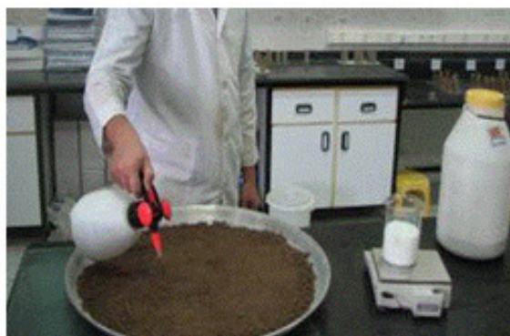
الف) چگونگی افزودن پلیمر به سطح خاک