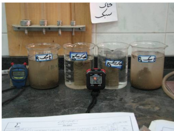
شکل شماره ۲- مراحل مختلف انجام آزمایش پایداری

معیار دوام (مقاومت در برابر عوامل جوی) از شاخص های مهم در ارزیابی عمر مفید مصالح است. در مناطق با تناوب دمایی و یا تغییرات رطوبتی زیاد است، بایستی مقاومت نمونه در برابر عوامل جوی براساس آزمایش های استاندارد دوام شامل ذوب و یخبندان (freezing & thawing)، خشک و تر شدن های مکرر (weting & drying) و استغراق در آب ارزیابی و کنترل شود. در این تحقیق برای ارزیابی دوام از معیار استغراق در آب استفاده شد. روش استاندارد آزمایش دوام برای مواد مختلف متفاوت است. در این پژوهش از روش استاندارد ارائه شده برای مخلوط های خاک سیمان که تشابهی زیادی با تیمارهای مورد بررسی دارند، استفاده گردید. نمونه های آزمایشی مورد استفاده برای این آزمایش استوانه ای و با ابعاد قالب دستگاه تراکم هاروارد می باشند. نمونه ها بلافاصله پس از ساخت به مدت ۴ روز در محیط آزمایشگاه نگهداری شدند. پس از این مدت وزن و ابعاد نمونه ها یادداشت و نمونه ها به مدت ۵ ساعت در داخل آب و ۴۲ ساعت در داخل آون با دمای ۷۰ درجه سانتیگراد نگهداری شدند. بدیهی است در هر سیکل در اثر خشک و تر شدن های مکرر نمونه خشک و پوسته پوسته شده و بخشی از آن می ریزد و نهایتاً وزن نمونه کم می شود. روش ارزیابی در این آزمایش بدین صورت است که وزن نمونه ها قبل و بعد از هر مرحله، اندازه گیری و میزان افت جرم اندازه گیری می شود. شاخص مورد استفاده در این آزمایشگاه افت جرم می باشد که طبق تعریف عبارتست از