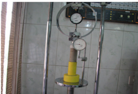
د) نمونه تحت آزمایش مقاومت فشاری