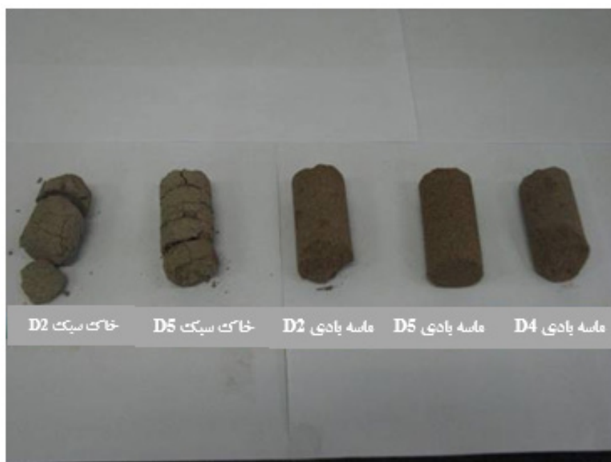
شکل شماره ۴ - وضعیت نمونه‌های آزمایشی بعد از طی سیکل‌های مختلف استغراق

از پارامترهایی است که کارایی امولسیون مورد استفاده را تحت تاثیر قرار می‌دهد. یعنی حجم امولسیون پلیمری اضافه شده به خاک جهت افزودن میزان پلیمر مورد نظر (۲۵ یا ۵۰ یا ۷۵ گرم ماده پلیمری) نیز مهم است. این مسئله از جنبه‌های اقتصادی و اجرایی حائز اهمیت است.