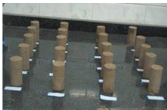
ج) نمونه های آزمایشی جهت انجام مقاومت فشاری